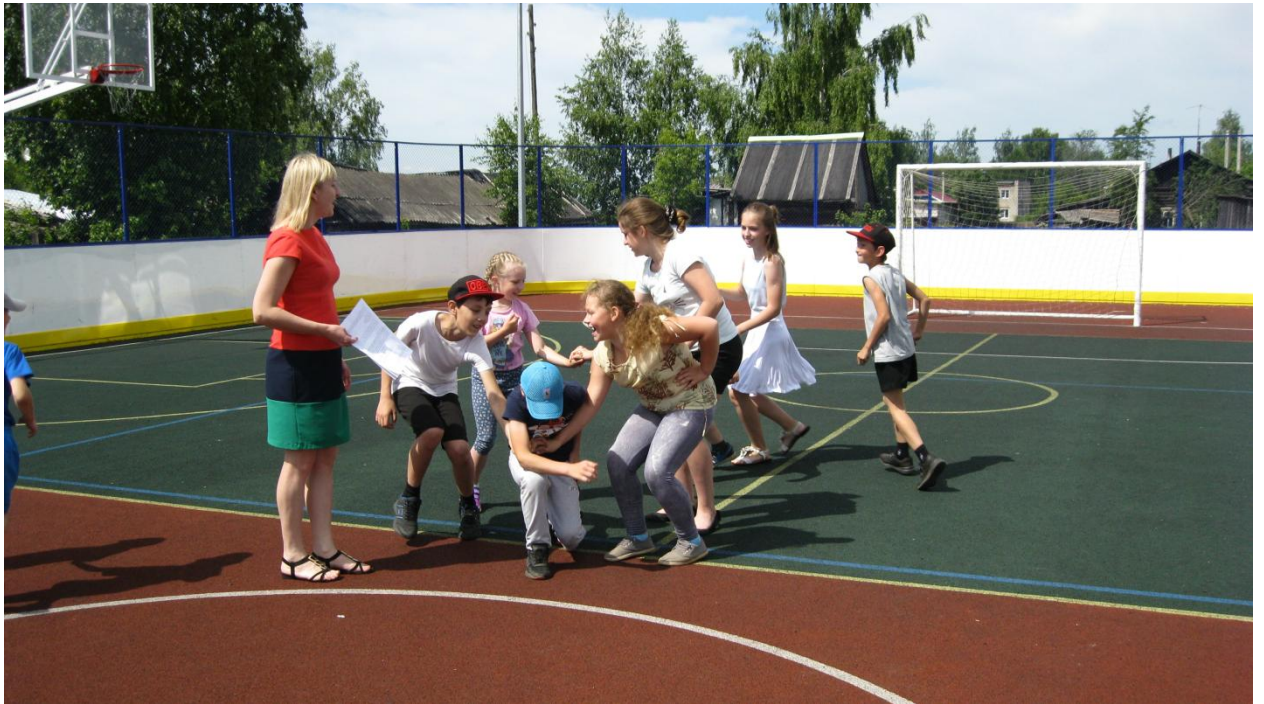
На стадионе поиграли в вятские народные игры.