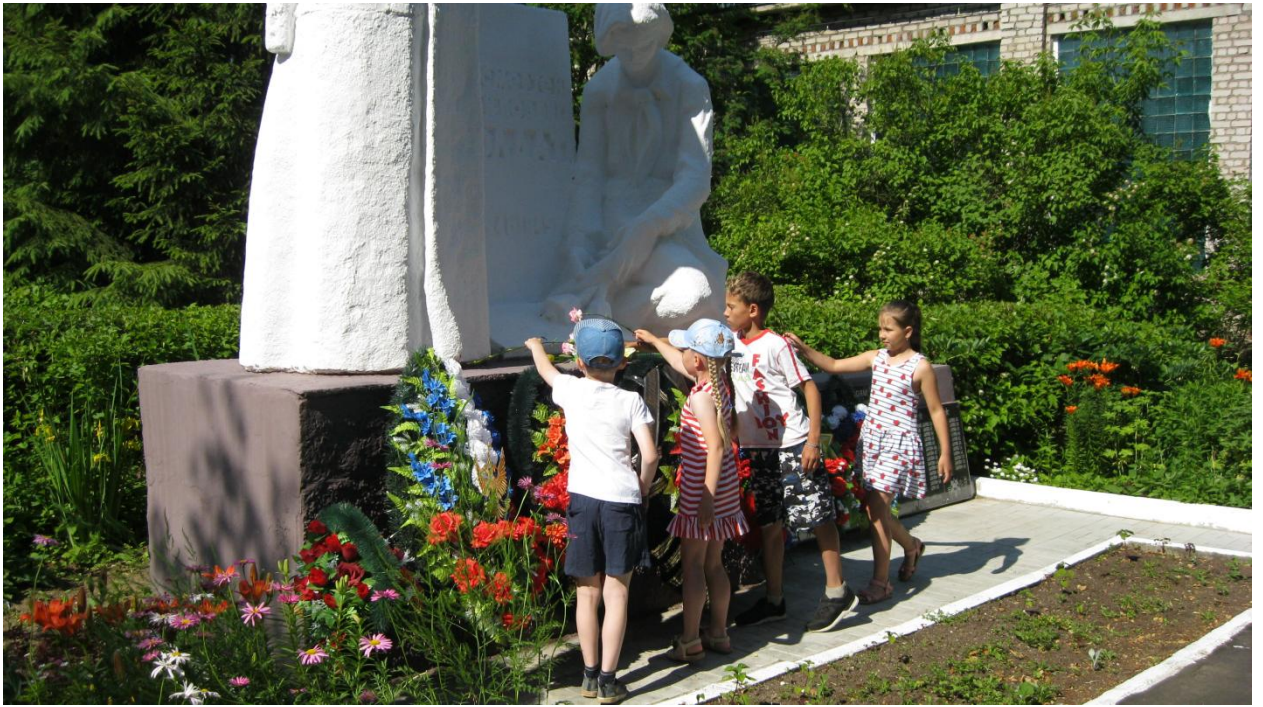
Возложили цветы к памятнику.